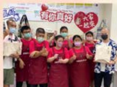
歡迎來玩美布工坊囉!

庇護員工學習穿針引線、操作縫紉機、拷克機、製作擦拭布、大小毛巾、運動毛巾、浴巾、手提提袋及承接客製化產品。庇護者短期內無法進入一般競爭性就業市場，經職業輔導評量，提供庇護性就業支持的服務。期望促進身心障礙者就業機會，協助習得一技之長並能夠提昇其自信心，找到自我價值並培養經濟自主的能力。給予學習與訓練提供良好環境，待庇護員工習得基本職業能力及應對技巧後再進入一般職場作接軌穩定就業。