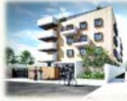
位於宜蘭縣三星鄉大地段