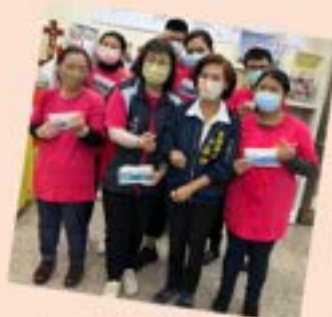
林姿妙縣長與我們一起~