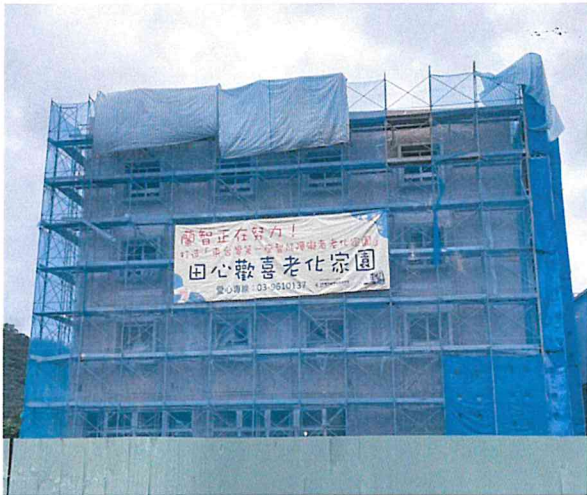
四層樓建築物外觀(含磁磚)