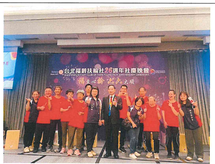
台北福齡扶輪社活動