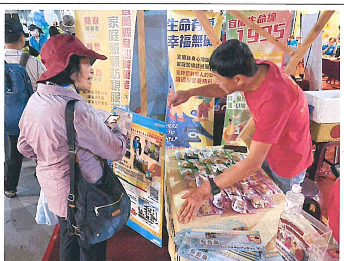
身障者日設攤活動