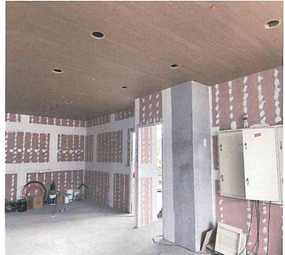
二樓、三樓交誼廳室內隔間空間