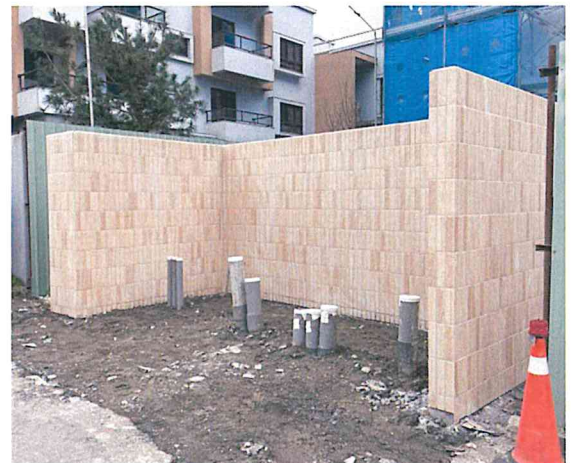
一樓室外台電受電場所現況