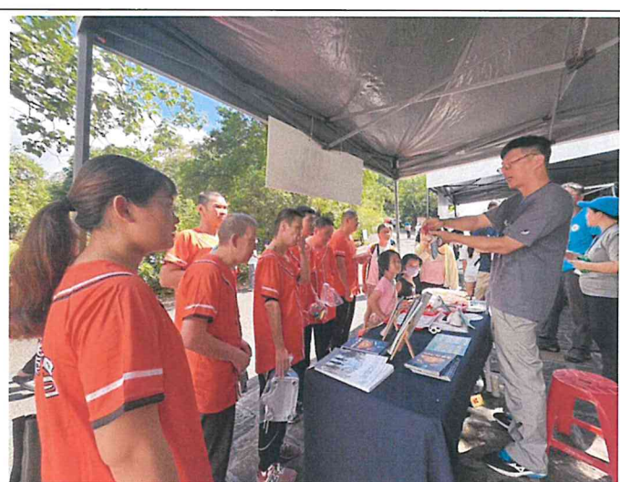
仁山 植物園綠行動大步走