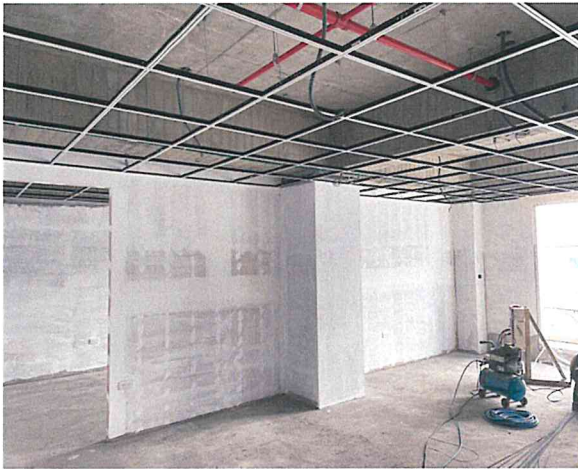
各樓層天花板輕鋼架組立