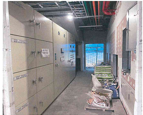
各樓層機房及共同管道間