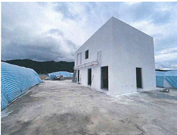
屋頂及屋突水箱現況