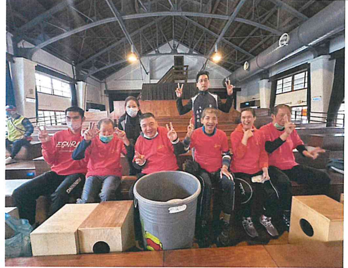
花蓮公益演出（打擊樂）